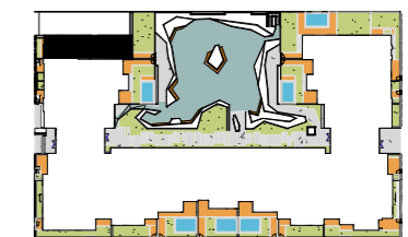
A-03 zone RDC